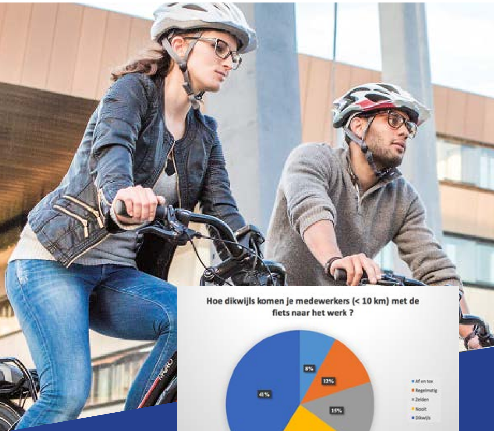
Hoe dikwijls komen je medewerkers (< 10 km) met de fiets naar het werk ?